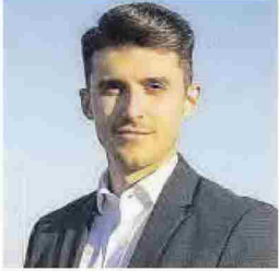
JORGE RIBES EDIL DE MOVILIDAD SOSTENIBLE Y USO DEL ESPACIO PÚBLICO DE CASTELLÓ