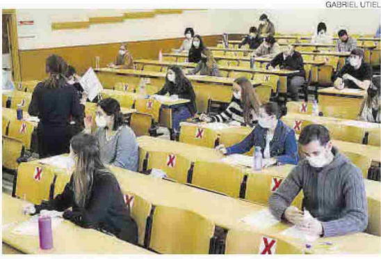
Exàmens del C1 de valencià a la Universitat Jaume I a l'any 2020.

Però això no es trasllada a la utilització en contextos socials. De fet, hi ha alguns elements preocupants, assenyalant Trenzano, qui destaca la davallada en l'àmbit de la llengua que s'utilitza preferentment a casa en Castelló ha baixat del 40,5% en 2015 al 33% actual. Al conjunt de la Comunitat són 8 punts els que es perden. Les causes són fruit de la mort dels