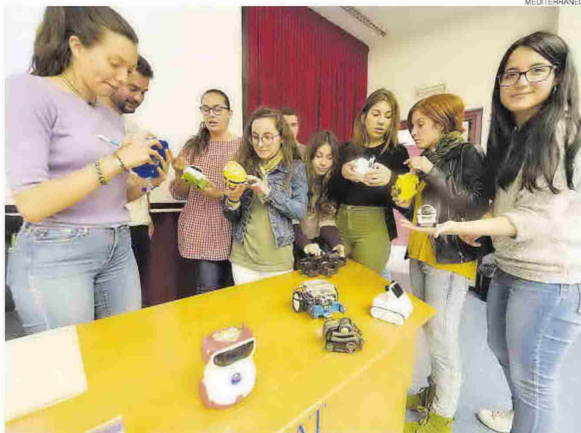
Imagen de archivo de unas jornadas sobre robótica que se llevaron a cabo en la Universitat Jaume I.

La UJI lleva tiempo luchando contra la brecha de género en las titulaciones, con iniciativas para estimular las vocaciones científicas y las inscripciones en las disciplinas STEM. Es el caso de la conmemoración del Día de la Mujer y la Niña en la Ciencia, en el que las investigadoras de la UJI llevaron