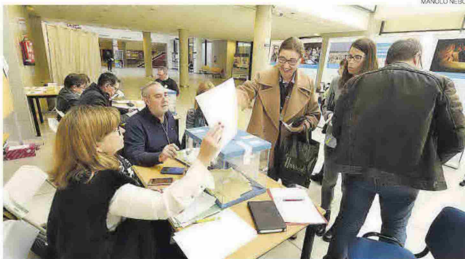
Imagen de la Universitat Jaume I, donde se desarrollaron las elecciones sindicales el 4 de diciembre del 2018.

REIVINDICACIONES // Entre las propuestas sindicales se encuentran algunas de tipo salarial, como la equiparación con otras comunidades mejor pagadas y recuperación de poder adquisitivo, reconocimiento a la función específica... También está en el punto de mira la prejubilación y la reducción horaria a los mayores.