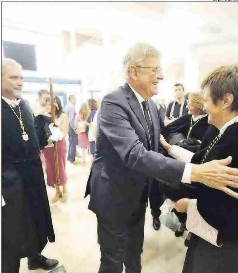
Ximo Puig, la semana pasada, abriendo el curso de las Universidades valencianas en Elche.

Puig reconoció que se hubiera podido tomar otra decisión, pero recordó que haber privado a la UA