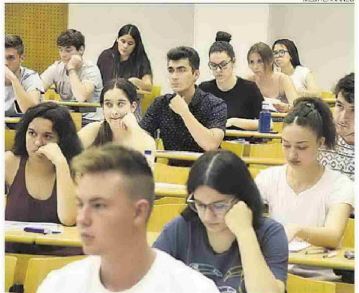
►► Imagen de las pruebas de acceso del año pasado, en Riu Sec.

También están inmersos en la búsqueda de flexibilidad, según las directrices del Ministerio,