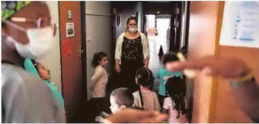
Niños atendidos en una escuela en Toulouse

A partir del comienzo de esa «segunda fase» del confinamiento, está prevista la vuelta al trabajo de sectores sensibles (peluquerías, algunos comercios). Por el contrario, se «aconsejará» la prolongación del confinamiento para personas de «cierta edad» (está por precisar la edad exacta) o con «problemas de peso».