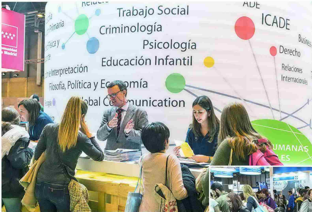
La directora de la feria explica que una prioridad es «impulsar que los jóvenes estudien lo que quieran», independientemente de su sexo