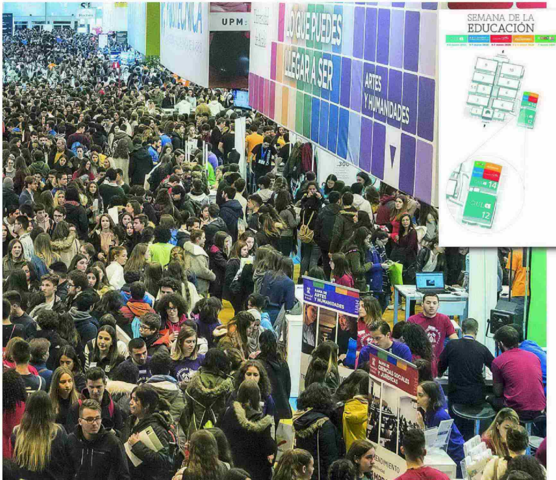
a la derecha, el plano de la feria

«Se trata de mostrar a los estudiantes las expectativas que representa el acceso a la carrera profesional en el ámbito de la Policía Nacional y de la Guardia Civil, así como en las que dan acceso al desempeño en otros centros directivos como la Dirección General de Tráfico, la Secretaría General de Instituciones Penitenciarias o la Dirección General de Protección Civil», explican desde el Ministerio. Siempre, eso sí, desde la perspectiva de unos valores universales alineados con la defensa de los derechos individuales y colectivos y de la convivencia pacífica. Además, todos los asistentes que se acerquen al stand del Ministerio del Interior podrán conocer en profundidad de mano de profesionales en activo cuales son las diferentes modalidades de acceso, los procesos selectivos, los planes formativos, los diferentes grados de carrera profesional y especialidades, así como los procesos de