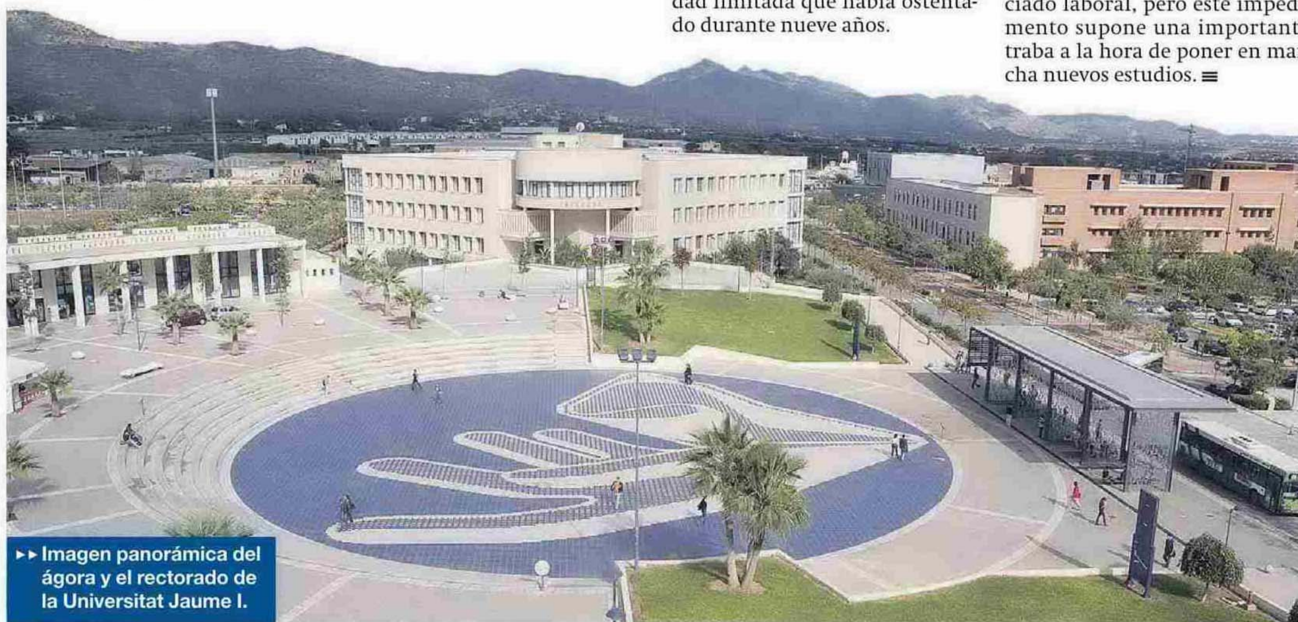
► Imagen panorámica del ágora y el rectorado de la Universitat Jaume I.

Uno de los problemas que arrastra la UJI es el hecho de no poder contratar personal fijo por la cuota de reposición marcada por ley por el Ministerio de Hacienda. Para poder impartir todas las materias, se emplea a profesorado asociado laboral, pero este impedimento supone una importante traba a la hora de poner en marcha nuevos estudios. ≡