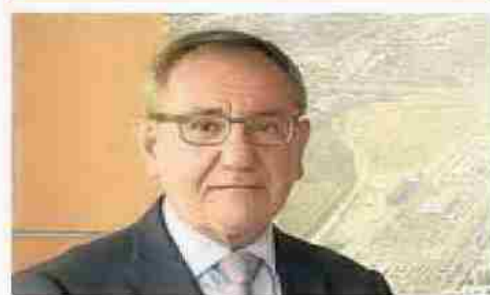
VICENT CLIMENT RECTOR DE LA UJI

«Castellón corre el riesgo de quedarse solo con media facultad o dilatar su finalización. Las dos opciones son un fracaso»