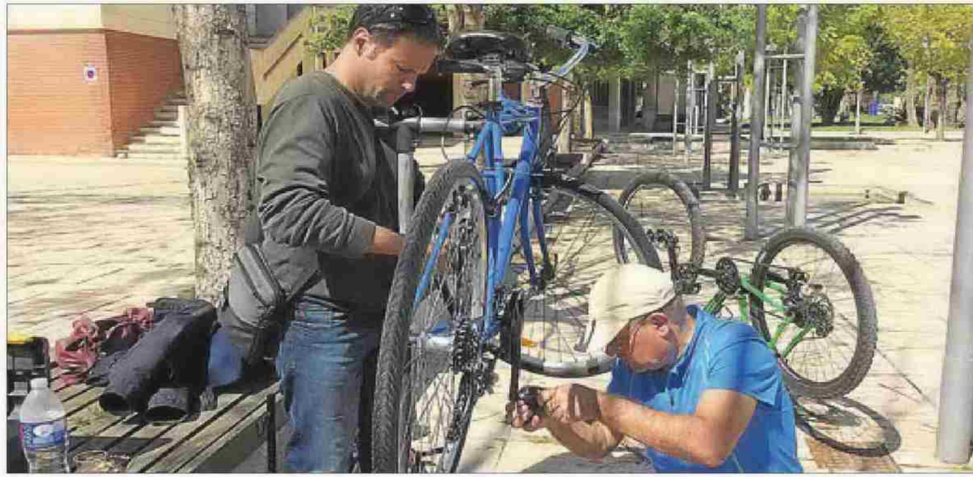
Dos alumnos del taller colocan los pedales en la bici tras engrasarlos. S. G. B.