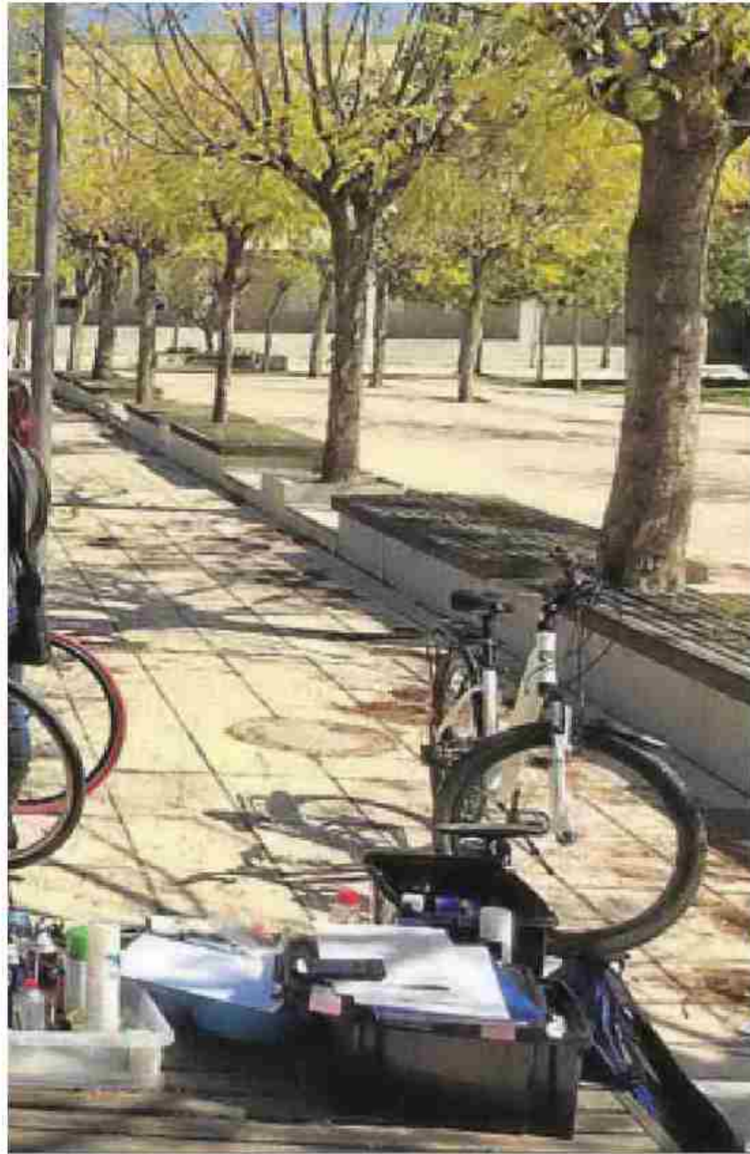
Derecho de la Universidad. S. G. B.