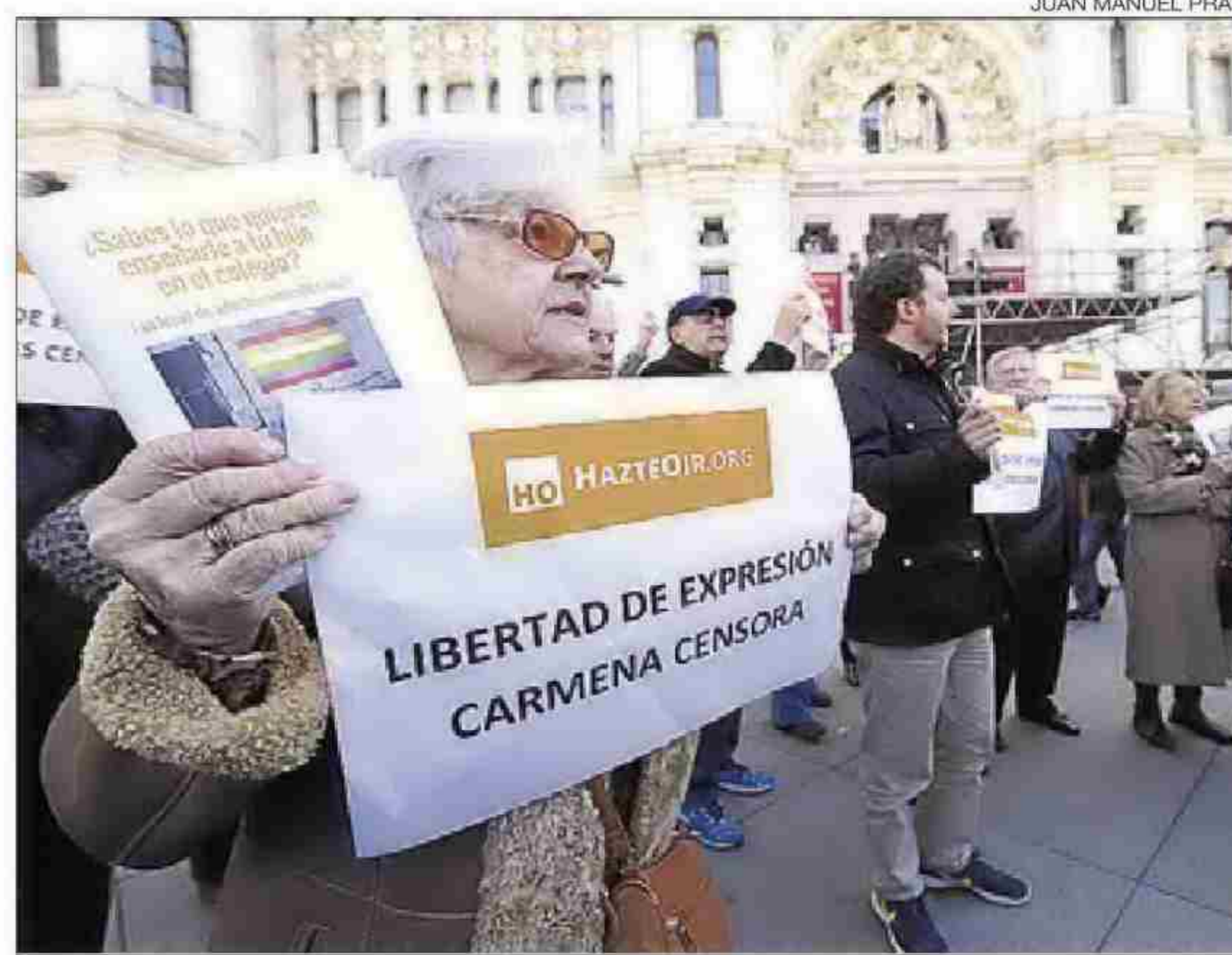
► Protesta d'Hazte Oír, ahir, davant de l'Ajuntament de Madrid.

missatges discriminatoris que exhibeixen, de conformitat amb el que disposa l'article 510.6 del Codi Penal i l'article 13 de la llei d'enjudiciament criminal.