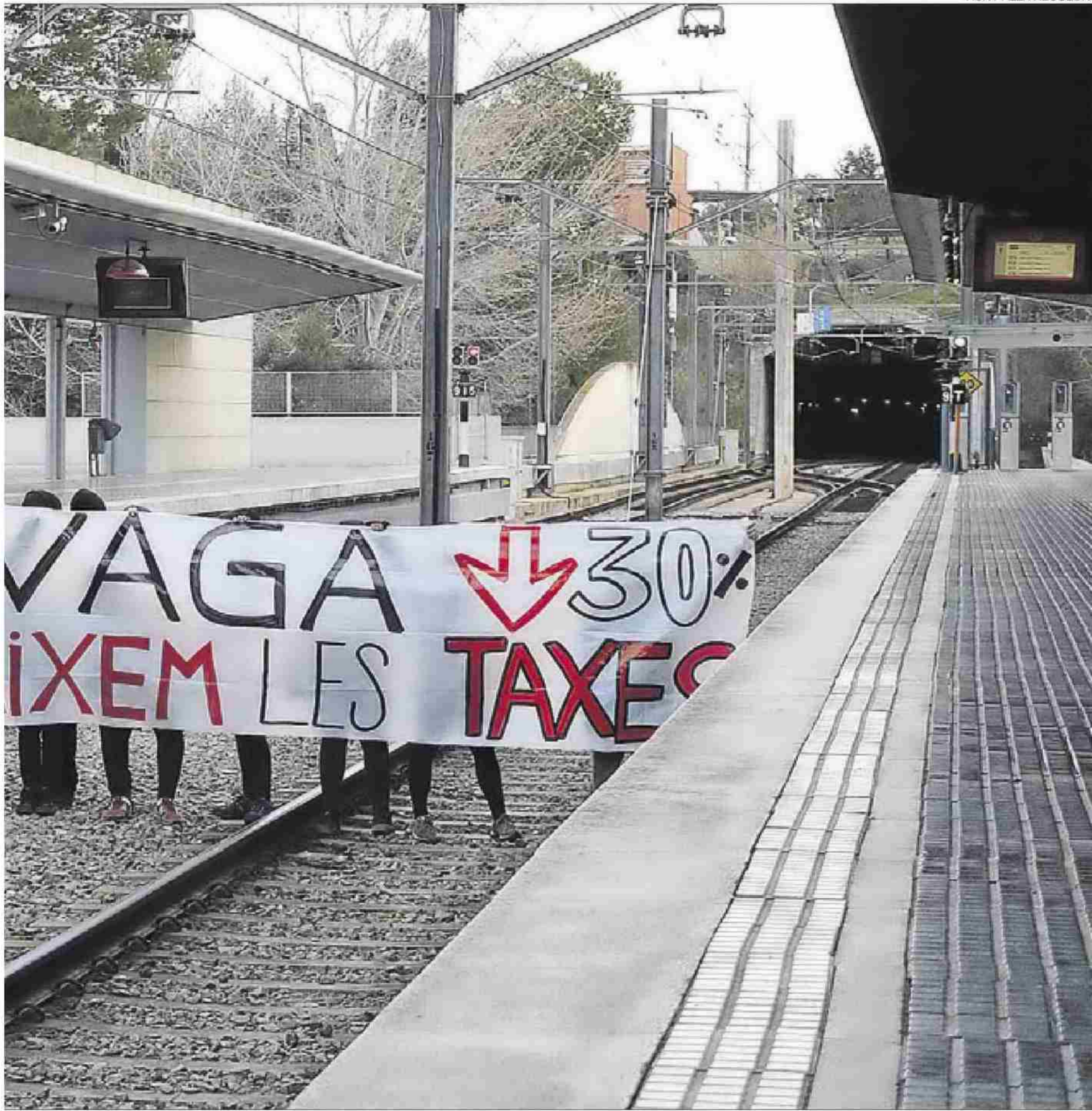
ACN / ÀLEX RECOLONS