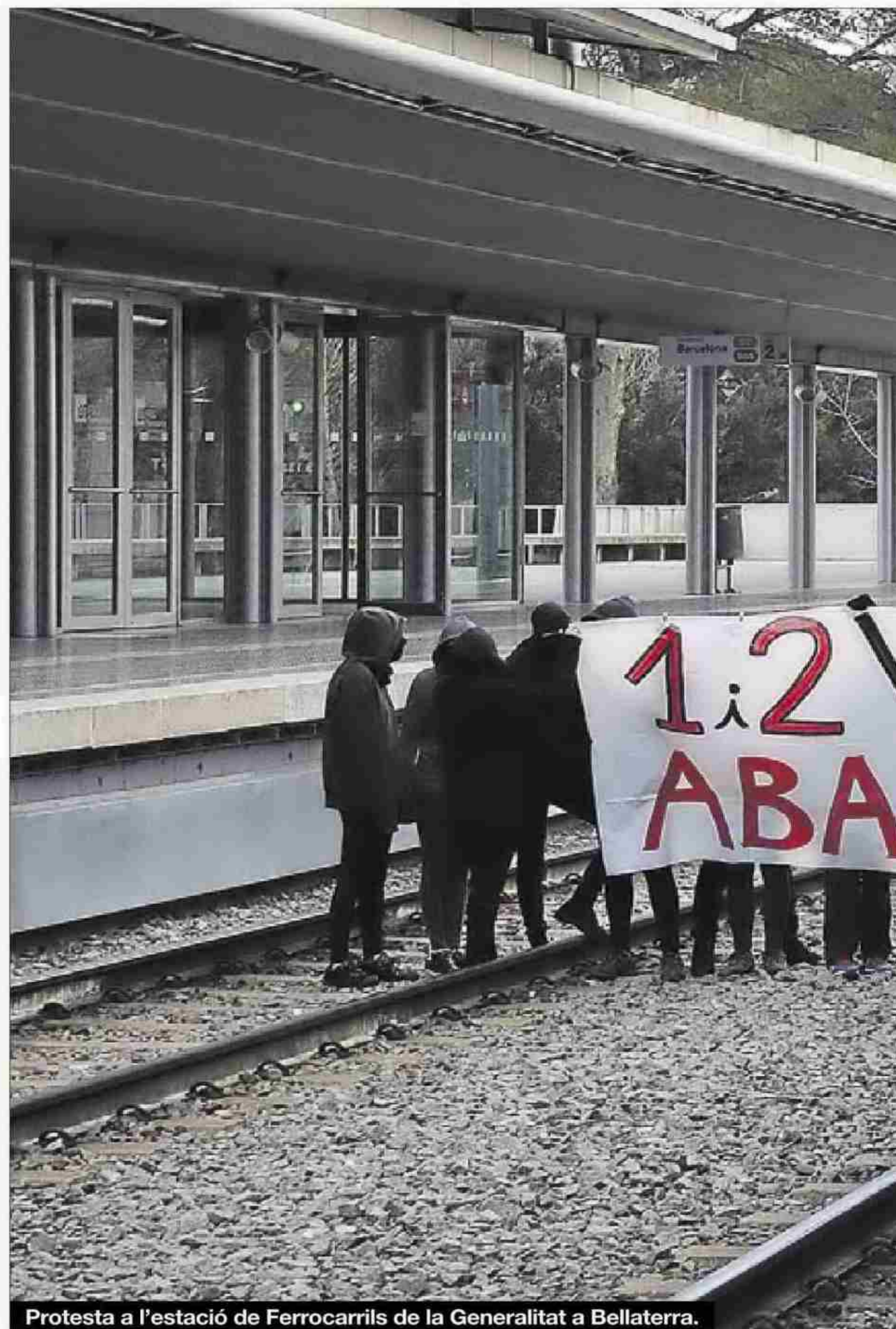
Protesta a l'estació de Ferrocarrils de la Generalitat a Bellaterra.

«Es fa necessari un finançament que permeti a la universitat mante-