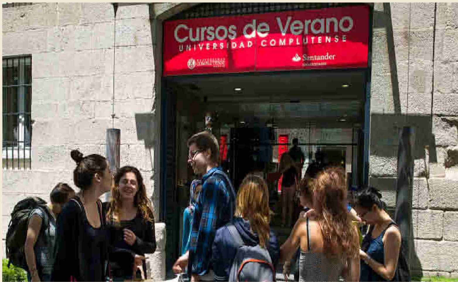
Un año más, la Universidad Complutense de Madrid celebra sus cursos de verano en San Lorenzo de El Escorial.

Durante el mismo además de ayudar a los alumnos a entender los conceptos que vertebran los diferentes espectáculos previstos de la próxima temporada, se profundizará en algunas de las obras más atractivas, ya sea por su novedad o por la originalidad de sus producciones, así como en las conexiones temáticas subyacentes entre creaciones distantes.