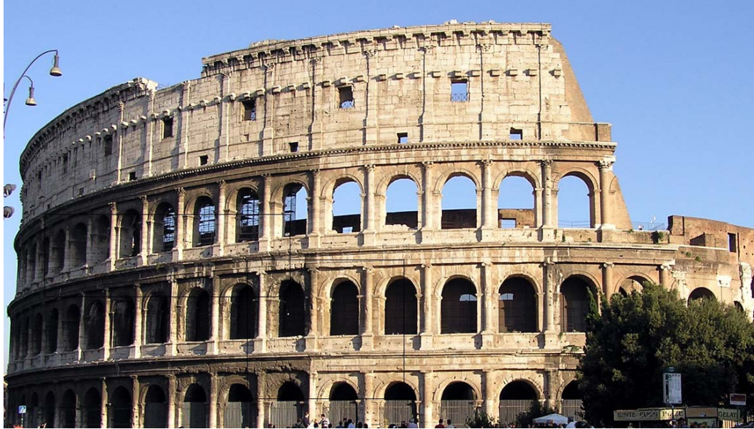
IMATGE 1 / IMAGEN 1