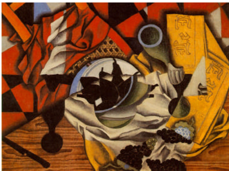
IMATGE 3 / IMAGEN 3

Peres i raïm en una taula. Peras y uvas en una mesa.