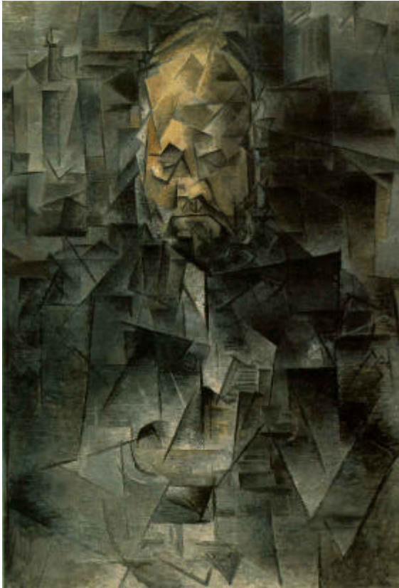
IMATGE 1 / IMAGEN 1