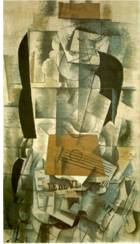
IMATGE 2 / IMAGEN 2