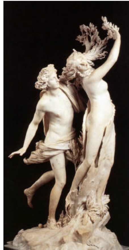
IMATGE 2 / IMAGEN 2