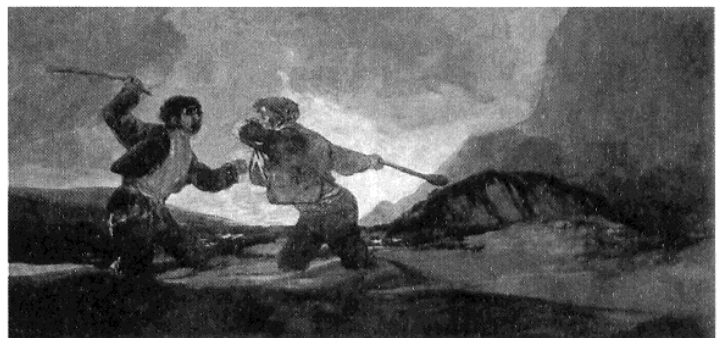
Imagen 3 / Imatge 3

Francisco de Goya. La vendimia. 1786-87 / Francisco de Goya. La verema. 1786-87