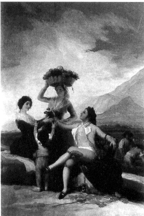
Imagen 2 / Imatge 2

Francisco de Goya. El 3 de Mayo de 1808 en Madrid los fusilamientos en la montaña del Príncipe Pío. 1814. / Francisco de Goya. El 3 de Maig de 1808 en Madrid els afusellaments de la muntanya del Príncep Pius. 1814.