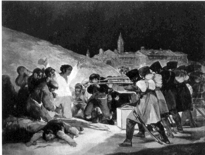
Imagen 1 / Imatge 1

Francisco de Goya. El 3 de Mayo de 1808 en Madrid los fusilamientos en la montaña del Príncipe Pío. 1814. / Francisco de Goya. El 3 de Maig de 1808 en Madrid els afusellaments de la muntanya del Príncep Pius. 1814.