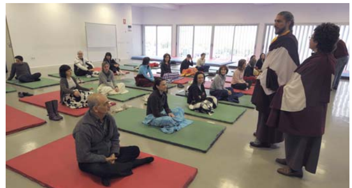
EL CURS "Les 4 passes essencials per al desenvolupament personal en el món acadèmic i d'investigació", organitzat per la Unitat de Suport Educatiu i impartit per la Fundació Monjos Budistes va tindre una gran acollida, completant-se les 25 places ofertes.