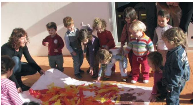
ELS XIQUETES I LES XIQUETES de l'Escola Infantil de la Universitat van celebrar, el passat 15 de febrer, la tradicional festa de sant Antoni, preparant les típiques coquetes i voltant la foguera amb animalets de peluix.

El principal repte que s'afronta ara és el de generalitzar les millores del procés docent, dutes a terme en el grup C, als grups del nou grau. Aquests seran més nombrosos i els estudiants seran més representatius dels alumnes de Psicologia pel que fa a la motivació i la capacitat de treball. Amb tot, aquests anys de treball són la millor garantia per a aconseguir-ho.