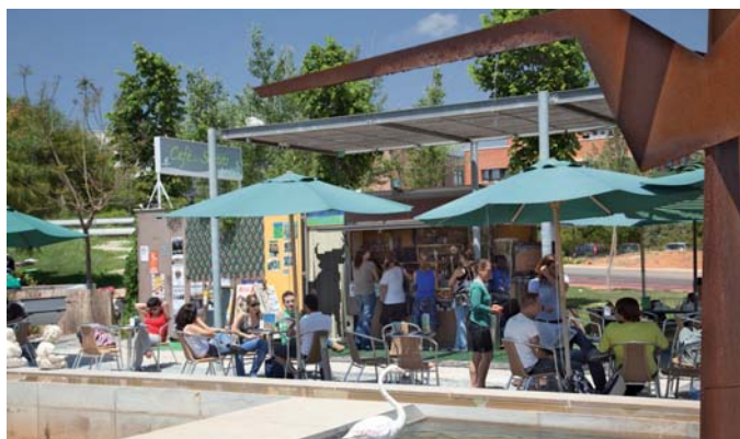
[El Cafè dels Sentits ha romàs obert durant l'agost per a donar servei a la comunitat universitària i, especialment, a l'estudiantat que prepara els exàmens de setembre.]

En l'article sobre les III Jornades de la Societat Valenciana de Neuropsicologia (SVNP) publicat en el número 97 del Vox UJI apareix el terme neuròleg quan el correcte és neuropsicòleg.