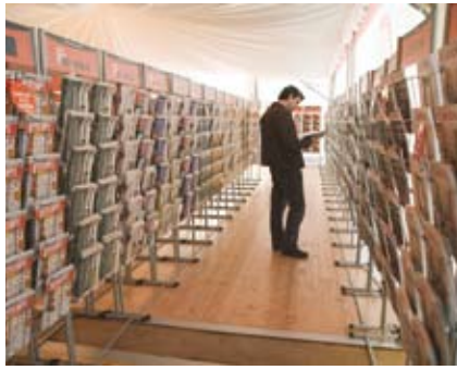
[El Quiosc.CAT, instal·lat a l'Àgora de l'UJI, reuneix l'actual oferta de publicacions d'informació general i especialitzada escrites en català i que es difonen als territoris de parla catalana.]