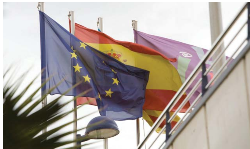
El procés de convergència europea és un dels objectius prioritaris reflectits en les línies de govern de la Universitat Jaume I.

Encara que l'objectiu és que els estudis universitaris siguin comparables a tot l'espai europeu, no s'estableix un catàleg estandaritzat de titulacions. Per tant, la definició centralitzada dels títols que ara hi ha a Espanya desapareixerà i es traspassarà a cadascuna de les universitats la responsabilitat de definir els seus títols i plans d'estudi.