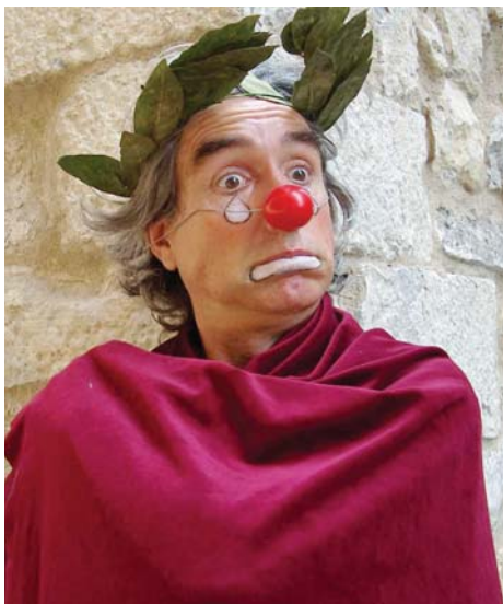
Sóc un pallasso de Claret i un dels espectacles que ofereix la 16a edició del Reclam.

LA 16a MOSTRA de Teatre, Reclam, es desenvoluparà del 6 al 30 de novembre en una dotzena de municipis de la província de Castelló. 30 companyies procedents de diferents llocs d'Espanya i d'altres països, com ara França o Argentina, oferiran, al llarg del mes de novembre, 70 actuacions en què es podrà veure tot tipus de teatre: noves dramaturgies, teatre familiar, humor, dansa, etc.