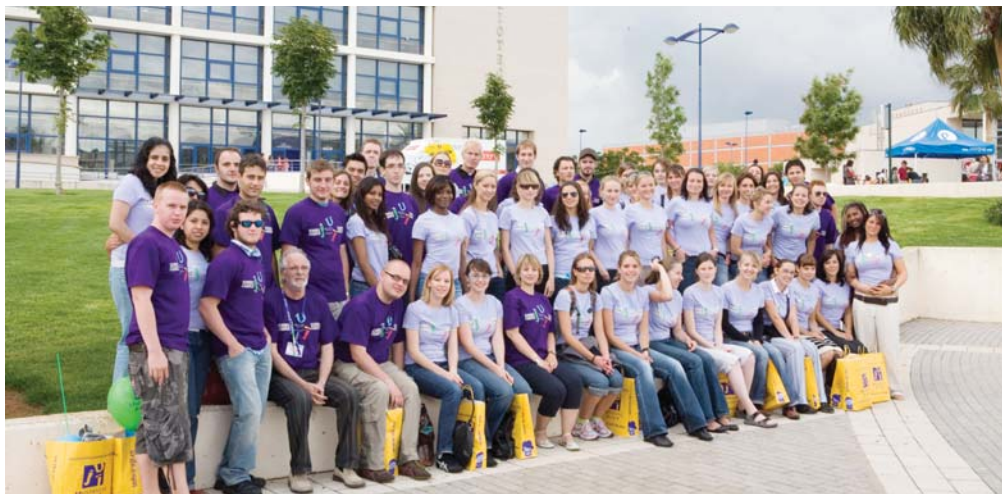
▲ Grup d'estudiants Erasmus a la Universitat Jaume I.

aquesta internacionalització s'estén a primer i segon cicle de les titulacions de l'UJI, on la xifra d'estudiants estrangers augmenta constantment any rere any.